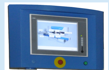
15" Touch Panel mit Separate Bedienungskonsole